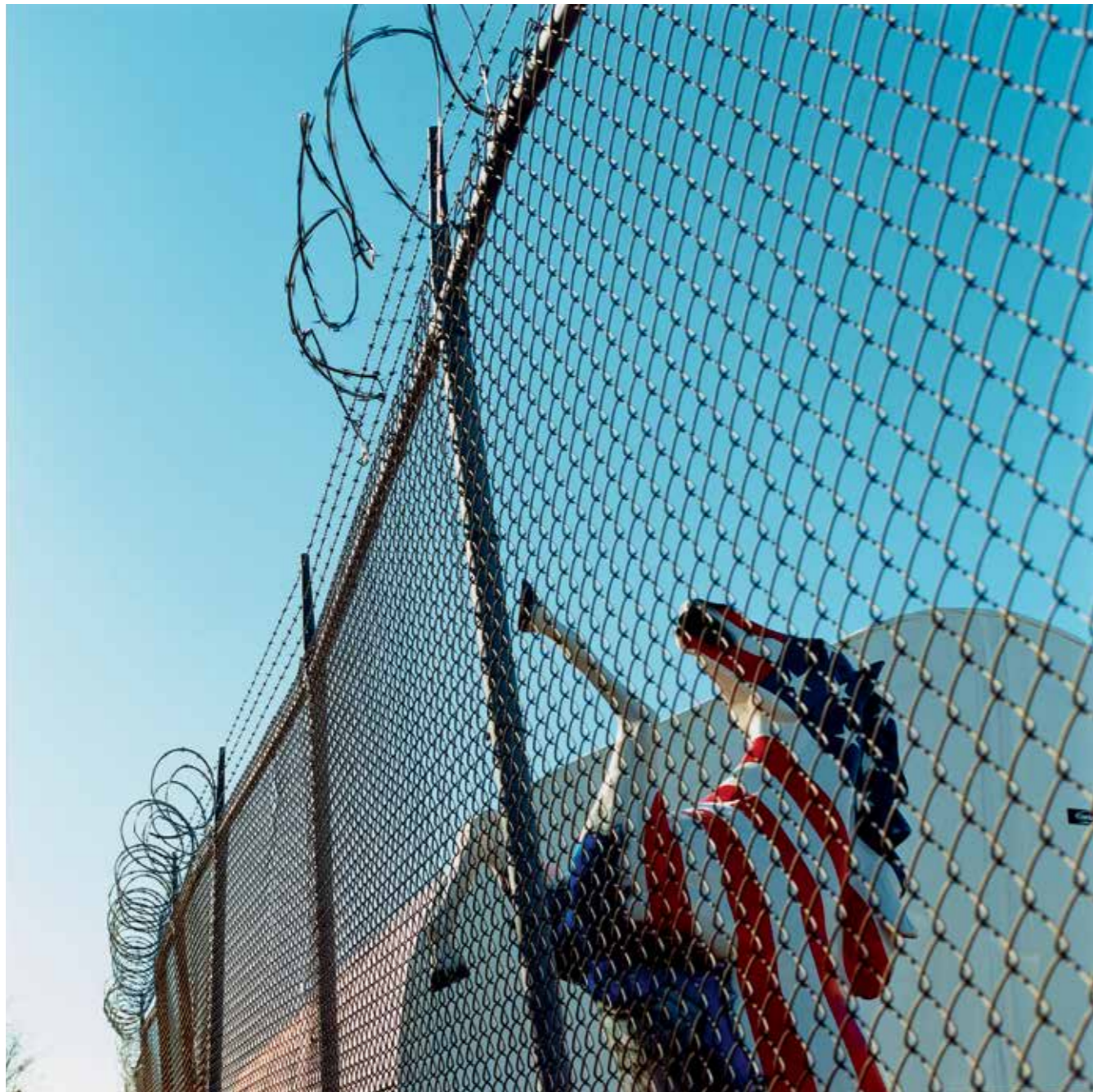
Behind the Fence, New York, 2007.