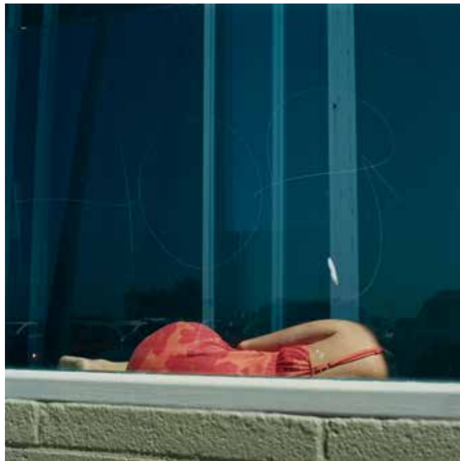
Nap, California, 2010.