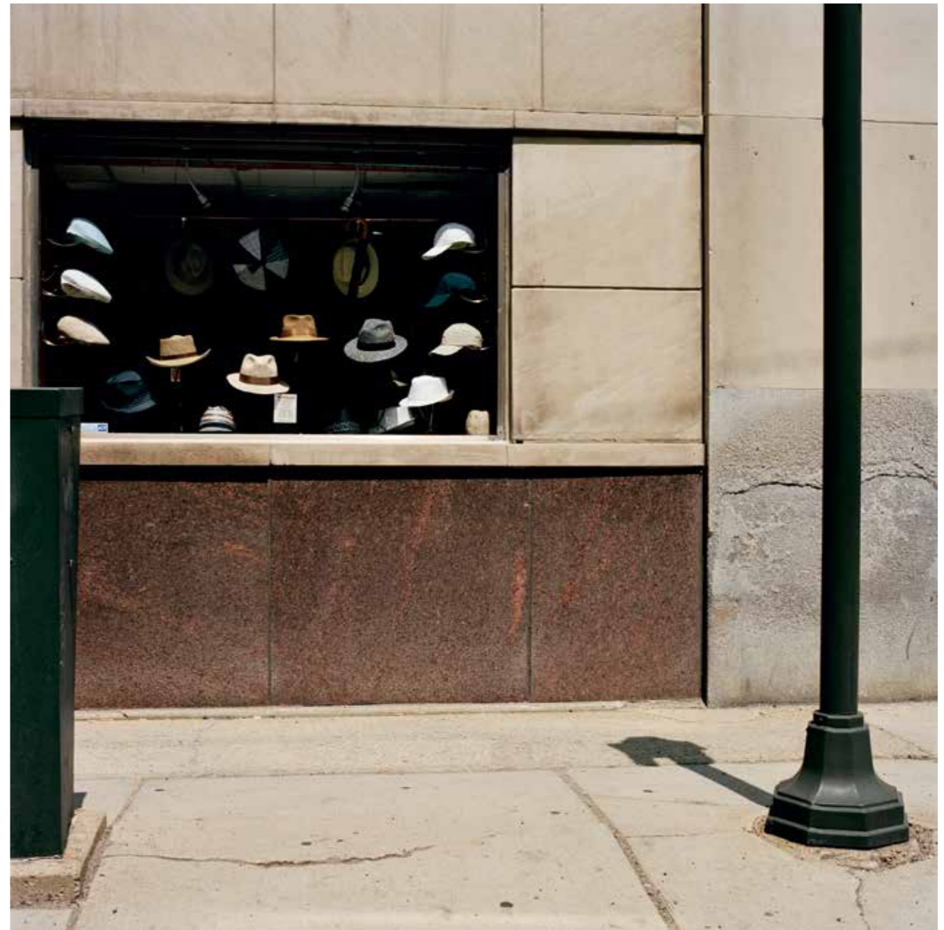
Hats, Michigan, 2009.