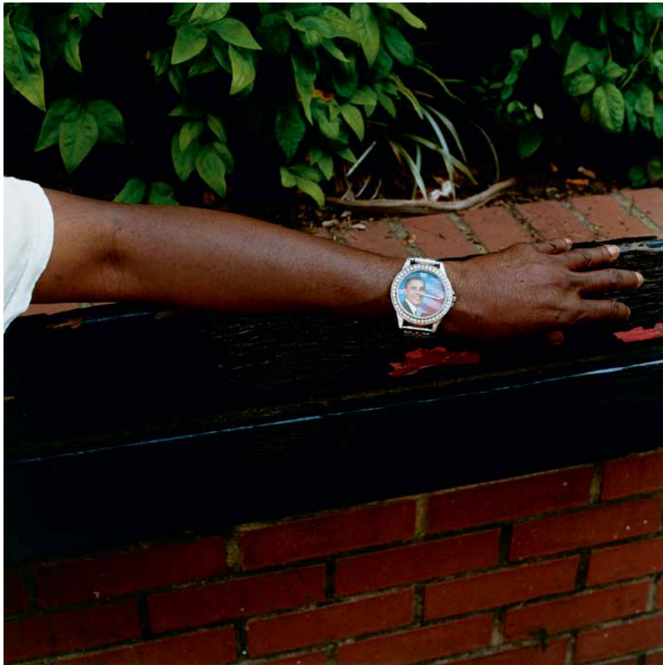
Barack, Georgia, 2010.