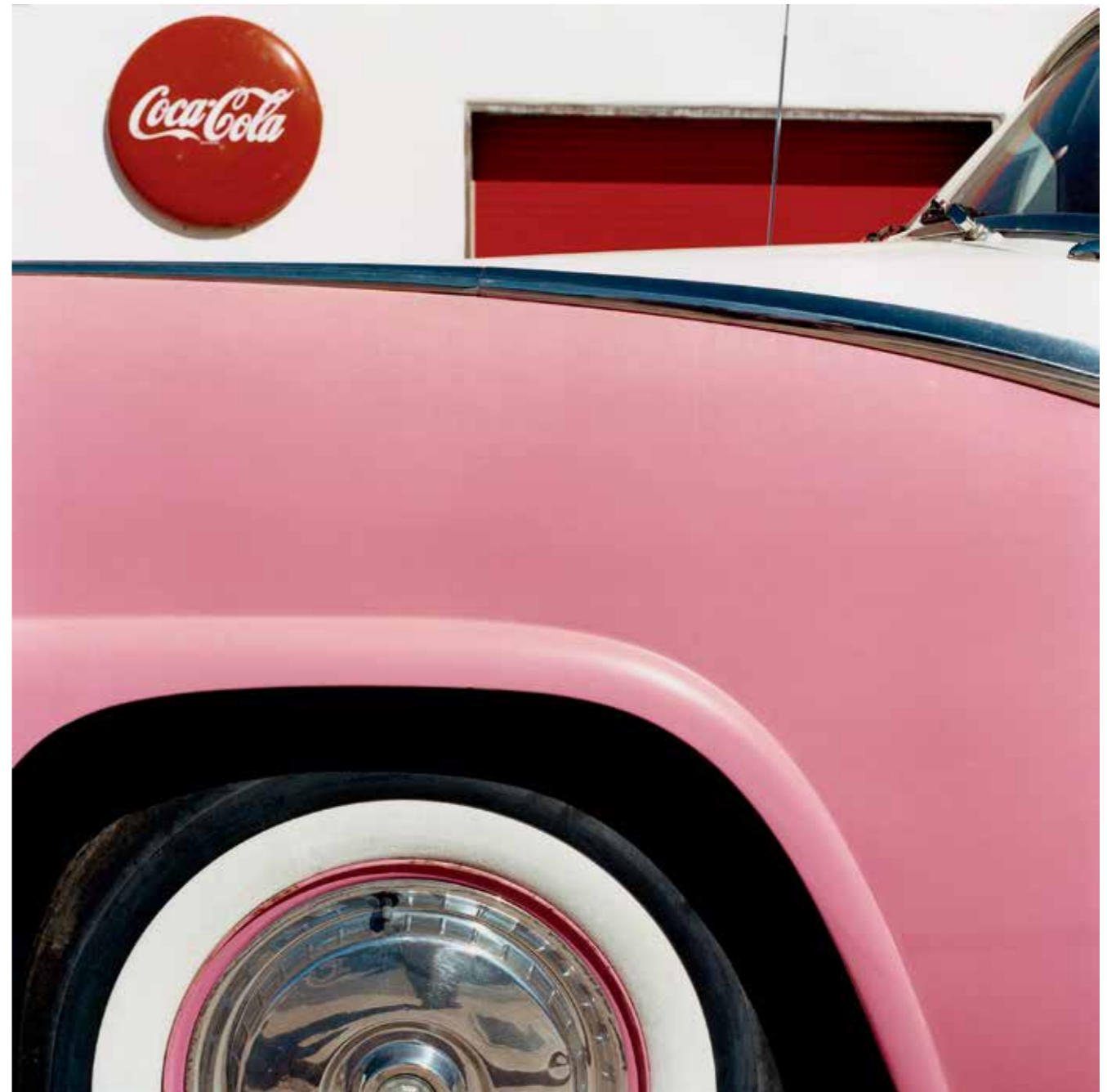
American Dream 1, Arizona, 2010.