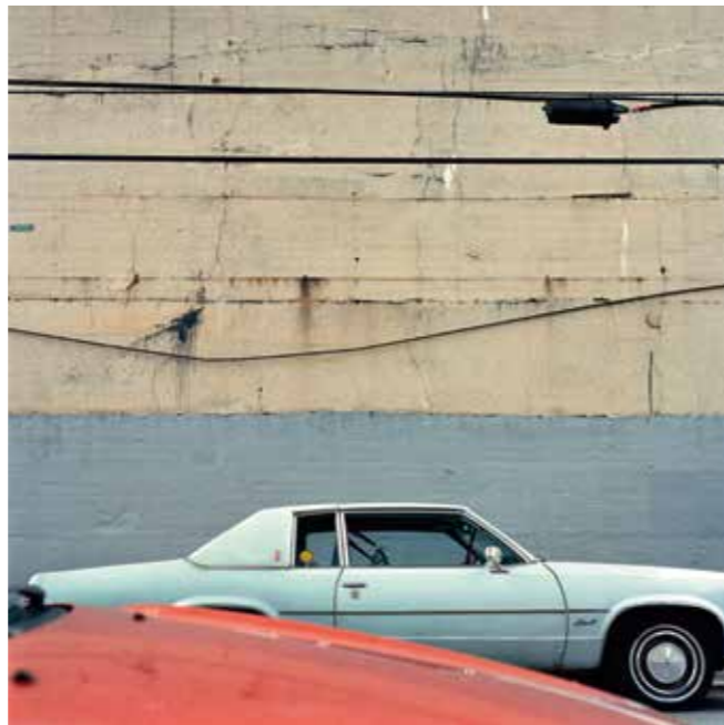
Blue Queen, New York, 2008.