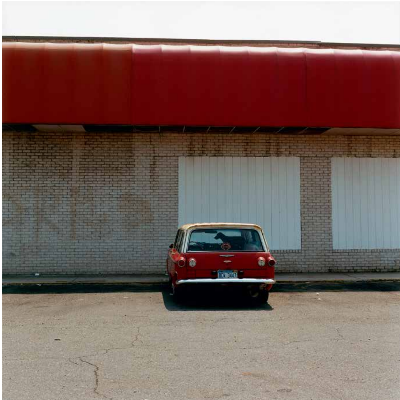
Reds, Michigan, 2009.