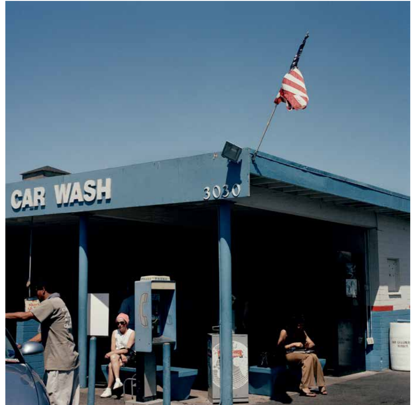
Car Wash, California, 2002.