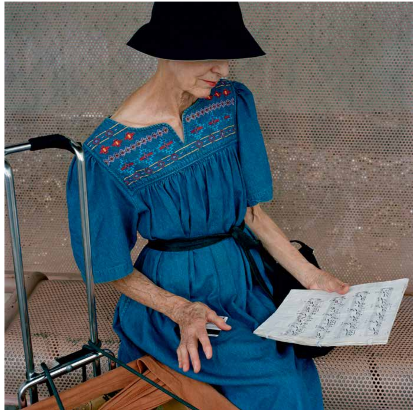
Bus Stop, Arizona, 2010.